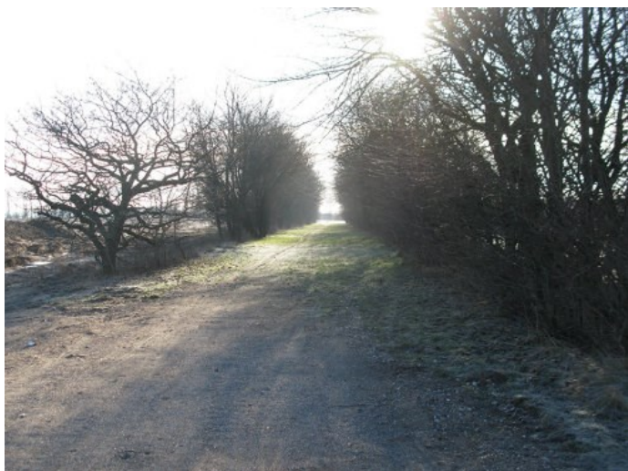
Bryrupbanestinen nord for lokalplanområdet.