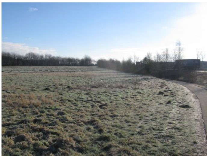
Lokalplanområdet set fra Provstlund Allé.