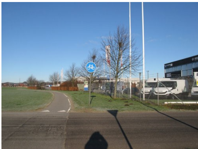
Erhvervsområde vest for lokalplanområdet.